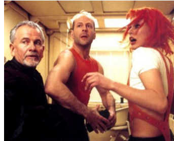
1997 LE CINQUIÈME ÉLÉMENT de Luc Besson avec Bruce Willis, Milla Jovovich