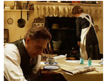
1982 LE RETOUR DU SOLDAT (The Return of the Soldier) d'Alan Bridges avec Glenda Jackson