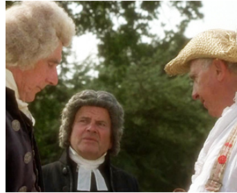
1994 LA FOLIE DU ROI GEORGE (The Madness of King George) de N. Hytner avec N. Hawthorne