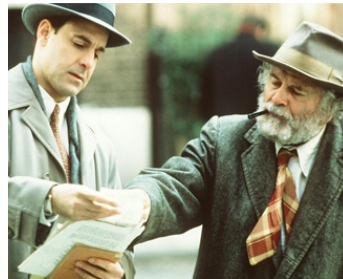
2000 LE SECRET DE JOE GOULD (Joe Gould's Secret) de et avec Stanley Tucci