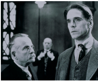
1991 KAFKA (Kafka) de Steven Soderbergh avec Jeremy Irons