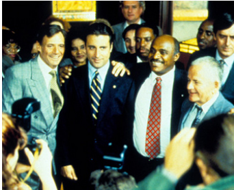
1997 DANS L'OMBRE DE MANHATTAN (Night Falls on Manhattan) de S. Lumet avec A. Garcia