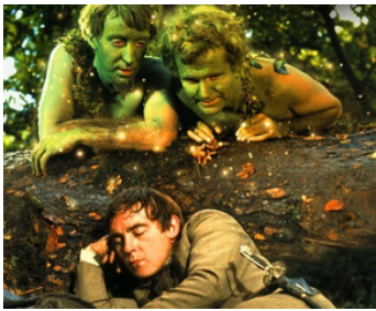
1968 LE SONGE D'UNE NUIT D'ÉTÉ de Peter Hall avec Michael Jayston, Ian Richardson