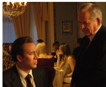
2005 LORD OF WAR (Lord of War) d'Andrew Niccol avec Nicolas Cage