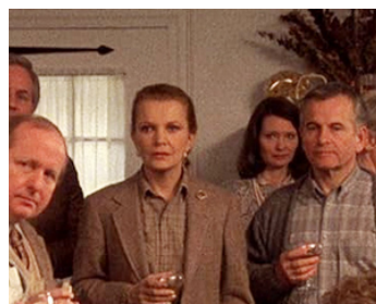
1988 UNE AUTRE FEMME (Another Woman) de Woody Allen avec Gena Rowlands