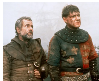
1989 HENRY V (Henry V) de Kenneth Branagh avec Kenneth Branagh