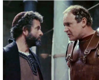
1977 JÉSUS DE NAZARETH (Gesù di Nazareth) de Franco Zeffirelli avec Rod Steiger