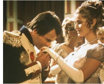
1974 NAPOLÉON ET L'AMOUR (Napoleon and Love) de R. Collin avec Stephanie Beacham