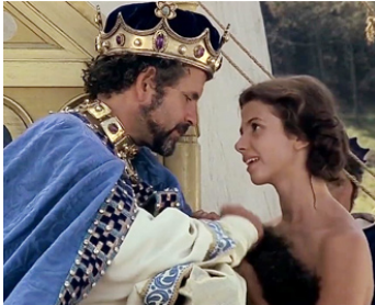
1976 LA ROSE ET LA FLÈCHE (Robin and Marian) de Richard Lester avec Victoria Abril