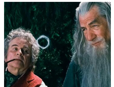
2012 LE HOBBIT, UN VOYAGE INATTENDU (The Hobbit) de P. Jackson avec Ian McKellen