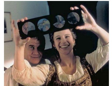
2001 THE EMPEROR'S NEW CLOTHES d'Alan Taylor avec Iben Hjejle