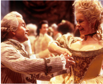
1994 FRANKENSTEIN (Mary Shelley's Frankenstein) de K. Branagh avec Helena Bonham-Carter