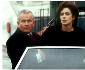
1992 BLUE ICE (Blue Ice) de Russell Mulcahy avec Sean Young