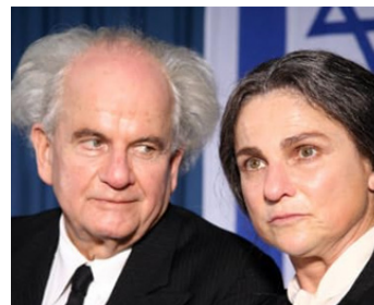
2006 Ô JÉRUSALEM d'Élie Chouraqui avec Tovah Feldshuh