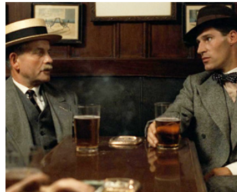
1981 LES CHARIOTS DE FEU (Chariots of Fire) d'Hugh Hudson avec Ben Cross