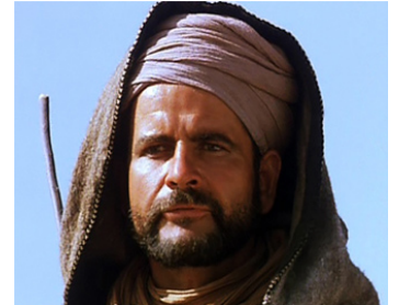
1977 IL ÉTAIT UNE FOIS LA LÉGION (March or Die) de Dick Richards