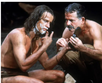
1984 GREYSTOKE, LA LÉGENDE DE TARZAN (Greystoke) d'Hugh Hudson avec Ch. Lambert