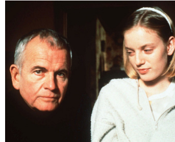
1997 DE BEAUX LENEMAÏNS (The Sweet Hereafter) d'Atom Egoyan avec Sarah Polley