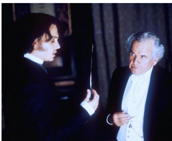
2001 FROM HELL (From Hell) d'Albert et Allen Hughes avec Johnny Depp