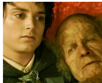
2003 LE RETOUR DU ROI (The Return of the King) de Peter Jackson avec Elijah Wood