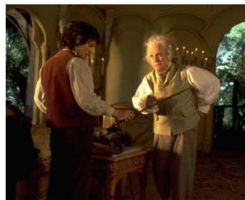
2001 LA COMMUNAUTÉ DE L'ANNEAU (The Fellowship of the Ring) de P. Jackson avec E. Wood