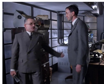
1985 BRAZIL (Brazil) de Terry Gilliam avec Jonathan Pryce