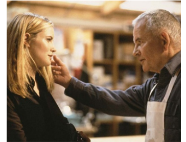
1999 EXISTENZ (eXistenZ) de David Cronenberg avec Jennier Jason Leigh