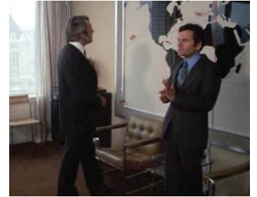
1974 TERREUR SUR LE BRITANNIC (Juggernaut) de Richard Lester avec Anthony Hopkins