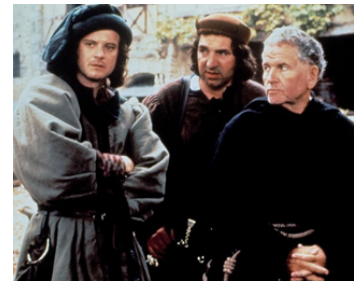
1993 L'HEURE DU COCHON (The Hour of the Pig) de Leslie Megahey avec C. Firth, J. Carter