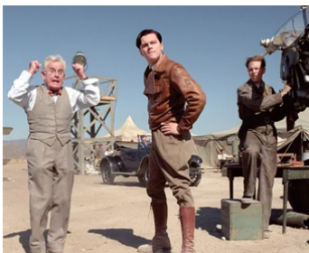
2004 AVIATOR (The Aviator) de Martin Scorsese avec Leonardo Di Caprio