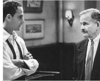
1996 À TABLE (Big Night) de Stanley Tucci et Campbell Scott avec Stanley Tucci