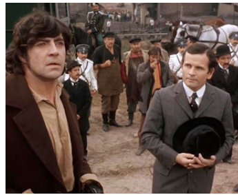
1968 L'HOMME DE KIEV (The Fixer) de John Frankenheimer avec Alan Bates