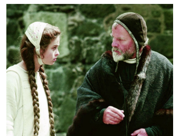
1990 HAMLET (Hamlet) de Franco Zeffirelli avec Helena Bonham-Carter