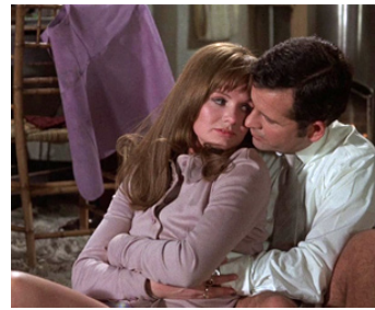
1970 UNE TÊTE COUPÉE (A Severed Head) de Dick Clement avec Jennie Linden