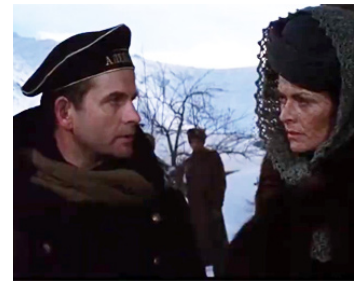
1971 NICOLAS ET ALEXANDRA (Nicholas and Alexandra) de F. Schaffner avec Janet Suzman