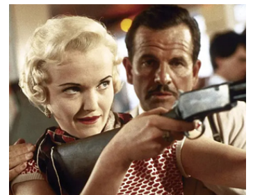
1985 UN CRIME POUR UNE PASSION (Dance with a Stranger) de M. Newell avec M. Richardson