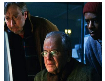
2004 LE JOUR D'APRÈS (The Day After Tomorrow) de R. Emmerich avec A. Lester, R. McKillian