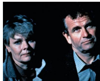
1985 WETHERBY de David Hare avec Judi Dench