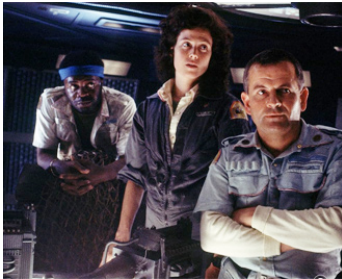
1979 ALIEN, LE 8 e PASSAGER (Alien) de Ridley Scott avec Yaphet Kotto, Sigourney Weaver