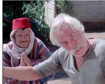
1976 PAROLE D'HOMME (Shout at the Devil) de Peter Hunt avec Lee Marvin