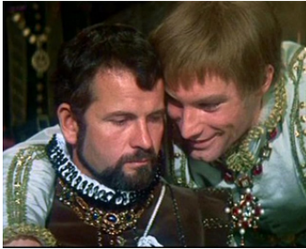
1972 MARIE STUART, REINE D'ÉCOSSE (Mary Queen of Scots) de Ch. Jarrott avec T. Dalton